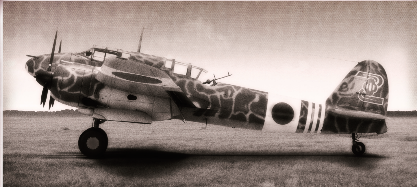
SWS No.14 - 1/32 川崎 キ45改甲/丙 二式複座戦闘機 屠龍 Kawasaki Ki-45 Kai Ko / Hei TORYU (NICK)