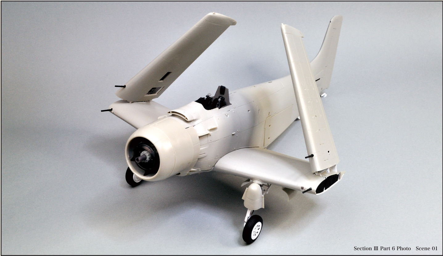
Section III Part 6 Photo Scene 01